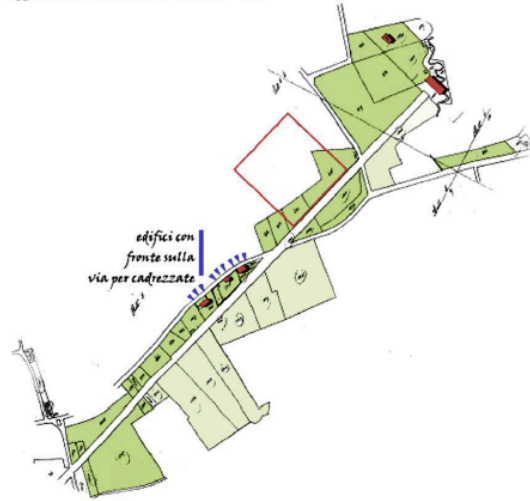
Aggiornamento Cessato Catasto Lombardo - 1889