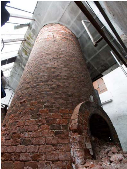
VISTA INTERNA AREA FORNACE