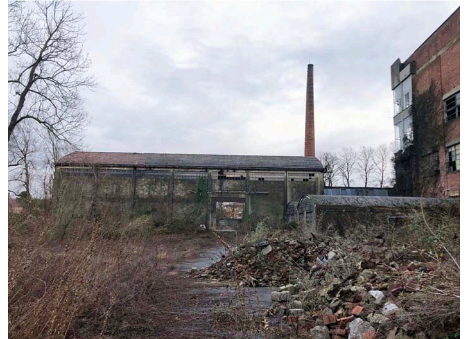
VISTA COMPLETA DA NORD