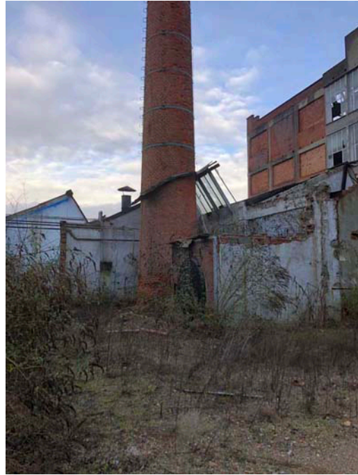
VISTA DA NORD