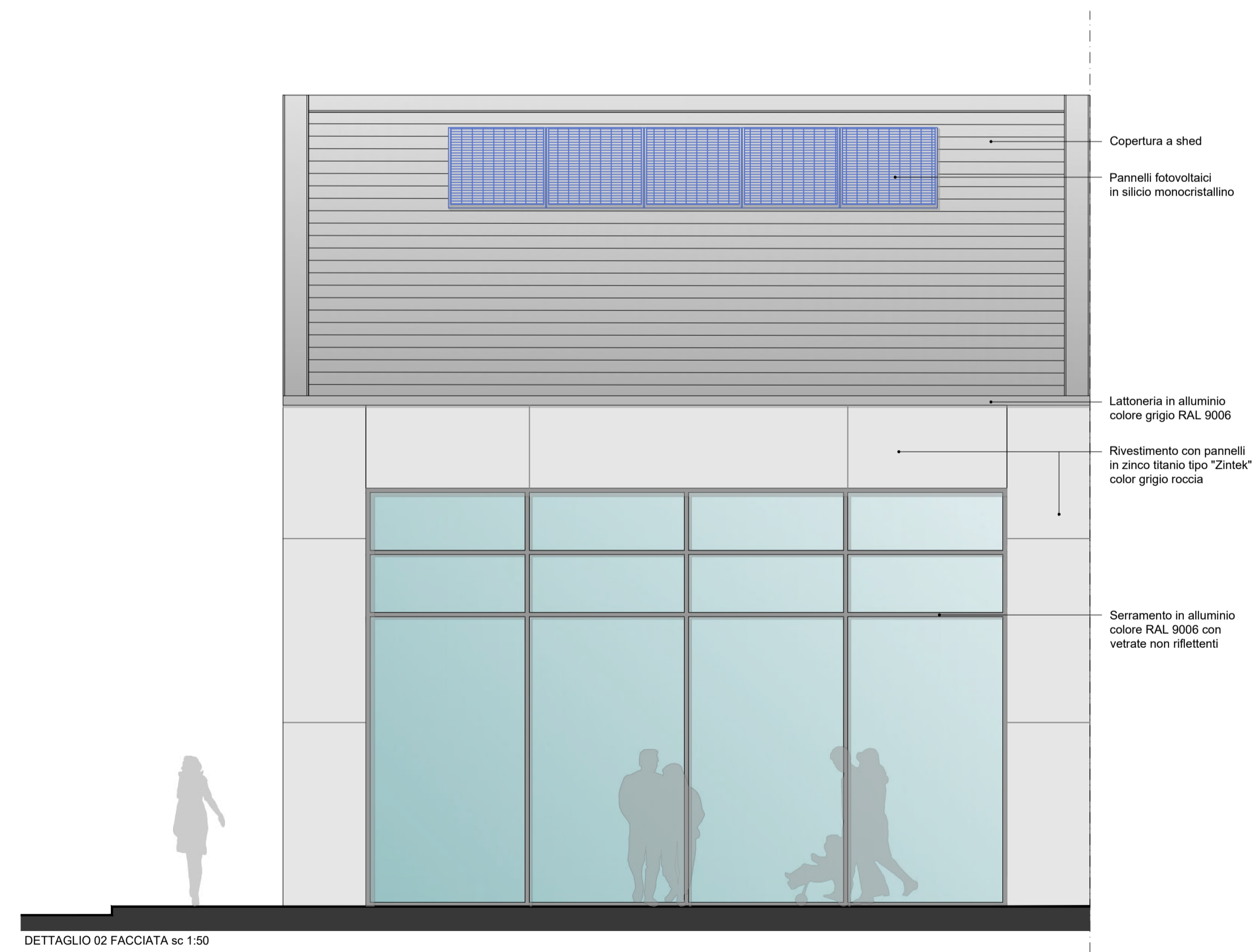
DETAGLIO 02 FACCIATA sc 1:50